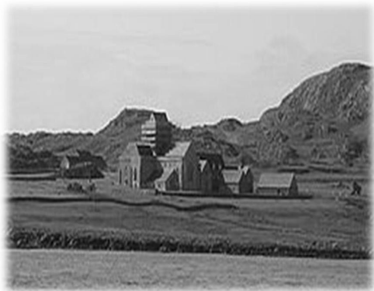
Abdij op het Schotse eiland Iona